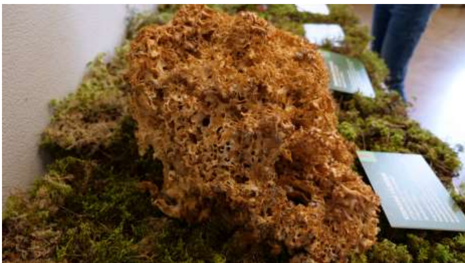
Sēņu izstādes fragments