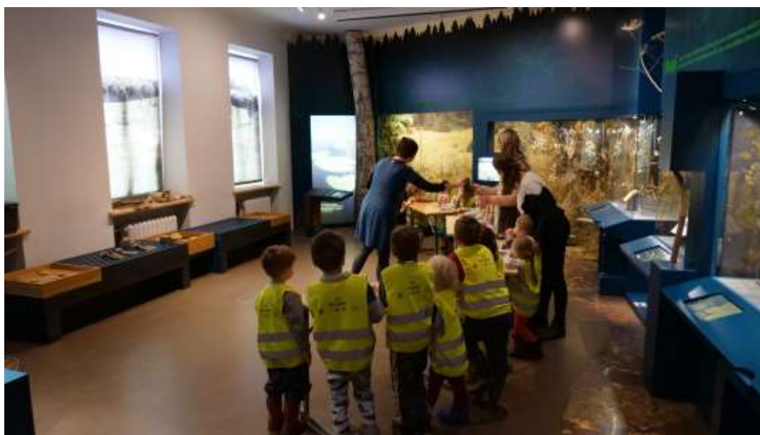
Nodarbība Botānikas un mikoloģijas ekspozīcijā