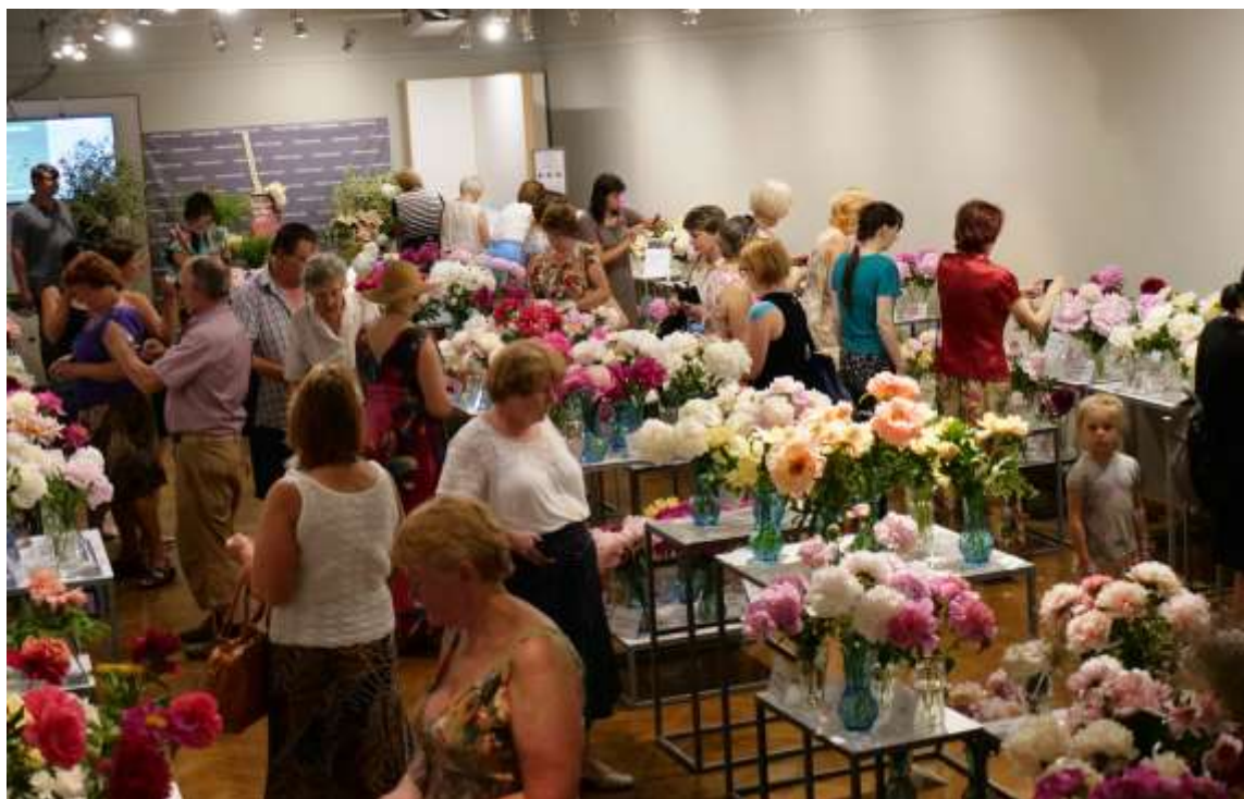
Peoniju izstādes fragments

Muzejam ilgstoša sadarbība izstāžu veidošanā ir izveidojusies ar Rīgas Dārzkopības un biškopības biedrību, Latvijas Gladiolu un īrisu biedrību, Latvijas Eksotisko augu draugu asociāciju, RDEK „Tomāts”, Latvijas vīnkopju un vīndaru biedrību, Biedrību „Lilium Balticum” u.c.