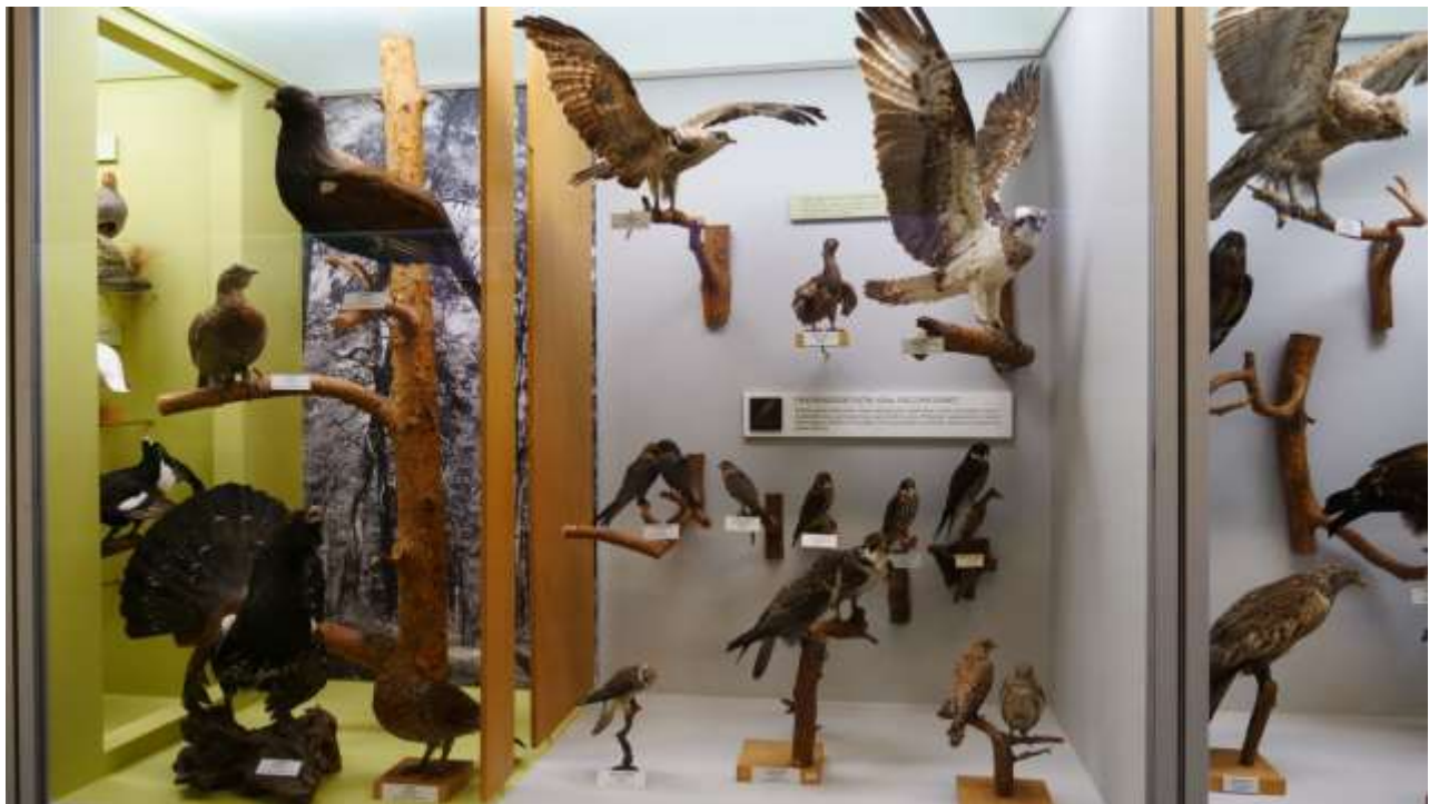
Latvijas putnu ekspozīcijas fragments